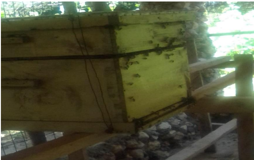
Ein bevölkerter Bienenstock.

Anfang 2020 soll der erste Honig von unseren neu gebauten Bienenstöcken gewonnen werden. Aus dem Erlös vom Honigverkauf sollen Bücher angeschafft werden, die aufgrund von neugeschaffenen Schulfächern im neuen Lehrplan benötigt werden.